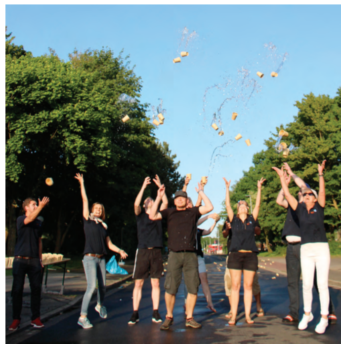
Das Stadtwerke-Team vom Wasserausschank sorgte bei sommerlichen Temperaturen für die nötige Erfischung der Läufer.

kend angenommen und auch unsere spontane Idee, angesichts des sommerlichen Wetters eine Dusche aufzustellen, fand großen Anklang bei den Teilnehmern. Es war ein schöner, sommerlicher Abend und es hat uns großen Spaß gemacht bei diesem beliebten Sportevent mit dabei zu sein. Am Wasserstand, an dem hoffentlich ganz viele Sportler neue Energie durch unser Trinkwasser tanken konnten und natürlich auch als Lauf-Team. Wir freuen uns auf den Heider Abendstadtlaf 2018.