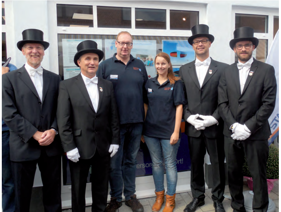
Auch eine Delegation der Süderregge gratulierte der Stadtwerke Heide zur Wiedereröffnung des neu gestalteten Kundencenters. Fotos unten: Der neue Schriftzug passt sich perfekt dem Gesamtbild der Süderstraße an. Sogar eine Torte mit Logo fehlte nicht.

Am 18.09.2015 war es soweit und die Umbau- und Renovierungsarbeiten in unserem Kundencenter konnten abgeschlossen werden. Zu diesem Anlass wurde eine große Wiedereröffnungsfeier im Kundencenter organisiert. Wir wollten unseren Kunden am Samstag, bevor der normale Arbeitsbetrieb wieder los geht, schon mal die Möglichkeit geben sich die neu gestalteten Räumlichkeiten ganz in Ruhe anzuschauen. Viele unserer Mitarbeiter haben an diesem Tag geholfen und auch die Kuchen, das Laugengebäck, die Muffins und der Waffelteig für den guten Zweck wurden alle von den Mitarbeitern selbst gebacken und hergestellt. Sogar eine Schwarzwälder Kirschtorte mit dem Wasserturmlogo der Stadtwerke wurde gebacken. Auch unser Geschäftsführer Herr Vergo und der Aufsichtsratsvorsitzende Herr Schmidt haben tatkräftig mit angepackt. Kaffee, Wasser, Sekt und Orangensaft gab es für die Kunden kostenlos, was auch sehr gut angenommen wurde. Für Groß und Klein wurde ein Gewinnspiel organisiert. Es gab 12 Wassertropfenbilder die verteilt im Kundencenter hingen und gezählt werden mussten. Für die kleinen Gäste gab es einen Malwettbewerb und kostenloses Kinderschminken, das Carmen Denkert und ihre Schwester Conni ganz toll gemacht haben. Der beliebte heiße Draht, den unsere Mitarbeiter aus dem E-Werk selbst gebaut haben, war eine weitere tolle Attraktion. Auch das Süderreggen Hahnbeer war mit dabei und hatte einen Stand