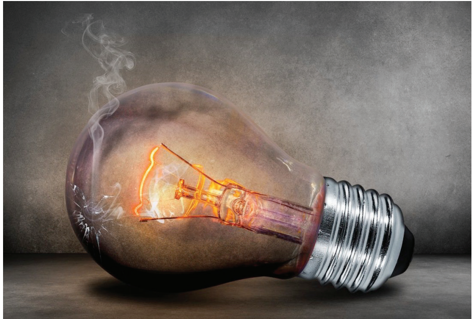
Die konventionelle Glühlampe ist ein regelrechter Stromfresser und wird in immer mehr Haushalten gegen energiesparende LED-Glühlampen ausgetauscht.

Wenn Sie eine 40 Watt Glühlampe 3 Stunden am Tag, 365 Tage im Jahr brennen lassen, kostet Sie das aktuell 12,42 € im Jahr. Tauscht man diese gegen eine